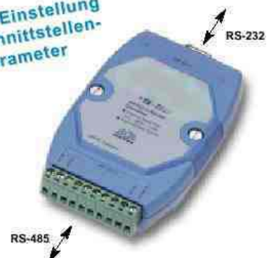
Bauform I-7510 /7520

autom. Einstellung der Schnittstellen- parameter