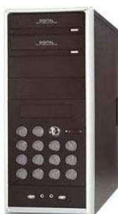
auch als Midi-Tower