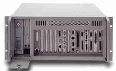
Frontloader-Slots nach vorne