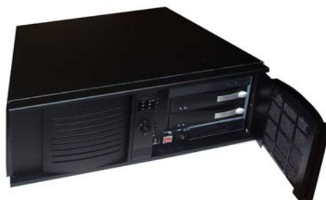
Rackgehäuse 6 Laufwerke